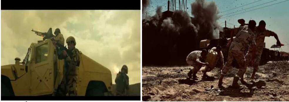
صورة (١٢) و (١٣) شكل الصراع بين قوات الجيش وبين الجماعات التكفيرية.