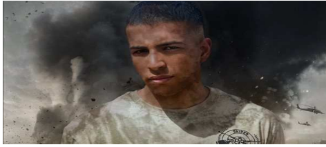
صورة (١١) الفنان عمرو محمود ياسين (الجندي أحمد عصمت)