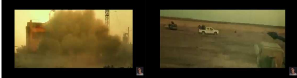
صورة رقم (٤) و (٥) هيكل البنية المكانية الدينامى أثناء الصراع