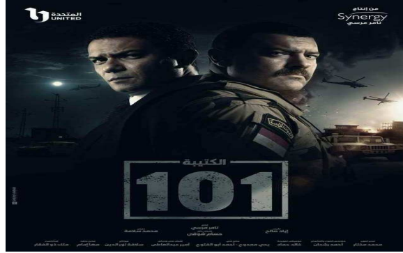
صورة رقم (١)

لضربات قضت عليها وسجن قادتها بدأ ظهورها وتحركاتها عقب ثورة ٢٥ يناير ، وقامت بهجوم كرم القواديس وهى عبارة عن عمليتان إرهابيتان ويعتبر الهجوم من أكثر الهجمات الإرهابية التى استهدفت الجيش المصرى دموية ، راح ضحية العملية الأولى التى وقعت فى الشيخ زويد ٣٠ جندى .